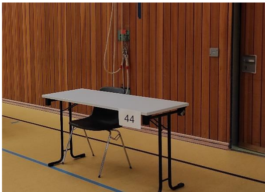
Tisch in der Turnhalle