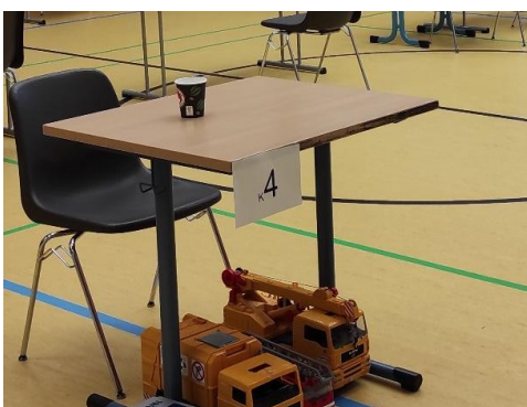
Kindertisch – 75 cm x 65 cm