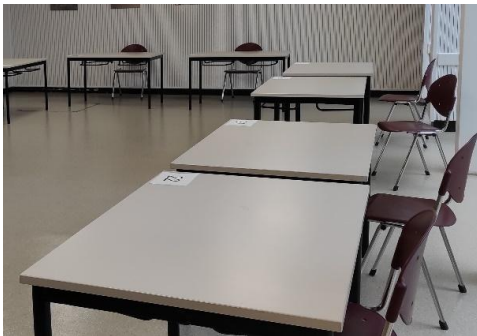
Tisch in der Mensa – 130 cm x 80 cm